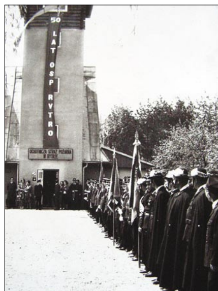
◆ Uroczystości 50-lecia OSP Rytró; 1978 rok.

Obchody 75-lecia istnienia OSP Rytró w 2003 roku, odbyły się przy licznych udziałach gości z zaprzyjaźnio-