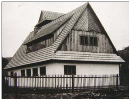
◆ Remiza wybudowana w latach 50.