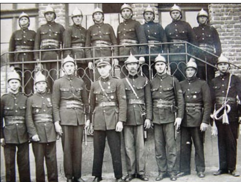
◆ Pierwsi druhowie w Rytrze.

Przez okres okupacji, oficjalnie straż została rozwiązana przez Niemców, trwała jednak w stałej łączności i gotowości w obronie pożarowej. Część strażaków opuściła Rytro udając się na front lub tułaczkę wojen-