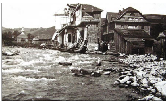
◆ Powódź w 1934 roku: nowo wybudowany dom mieszkalny „zmioczony” przez wodę.