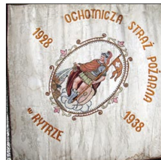
◆ Sztafeta ofiarowany jednostce na jubileusz 10-lecia.